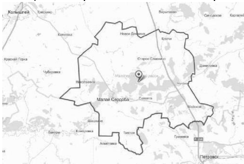
Рисунок 1. Район расположения объектов оценки на карте.